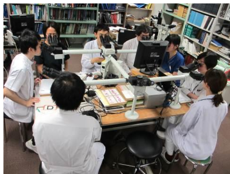
部内症例カンファレンス（ピアレビュー）

本プログラムでは、症例が豊富かつ多彩で、院内カンファレンスが充実している医療機関が連携し、前述のトレーニングを通じて実地に強い病理医を育成していきます。また、臨床研究に特に興味のある専攻医のために、院内での臨床研究や、社会人大学院への進学機会を提供します。