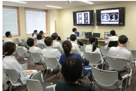
放射線病理カンファレンス

本専門研修プログラムでは、1 日 2 回の部内症例カンファレンス（ピアレビュー）参加を必修とし、他の病理医が診断する症例についてもともに鏡検し、学んでもらいます。また、臨床科とのカンファレンスも充実しており、特に放射線診断科との画像病理カンファレンスが週 2 回開催されていることが特色です。基幹施設ならびに連携施設におけるカンファレンスのみならず、日本病理学会中国四国支部主催のスライドカンファレンスや岡山外科病理研究会、さらに臨床他科の地方会・研究会には優先して参加してもらえます。積極的に出席し、希少例や難解症例に触れることを奨励します。