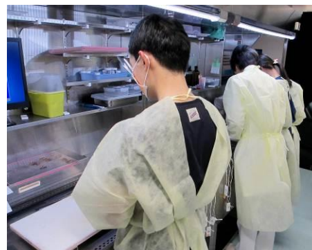
手術材料切出し業務