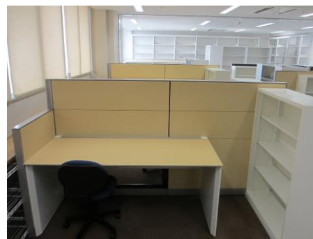
改装された病理診断室

剖検（病理解剖）に関しては、研修開始から最初の 2 例目までは原則として助手として経験します。以降は習熟状況に合わせてますが、基本的に主執刀医として剖検をしていただき、切り出しから診断、CPC での発表まで一連の研修をしていただきます。実際の剖検から最終報告