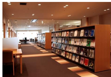
職員専用の図書館

基幹施設である倉敷中央病院ではピアレビューを採用しているため、自身が診断するよりも多くの症例を実際に経験し、必要な症例を担当診断医と共有して勉強することが可能です。また、専攻医マニュアル（研修すべき知識・技術・疾患名リスト）p.9～に記載されている疾患・病態を対象として、疾患コレクションを随時収集しており、専攻医の経験できなかった疾患を補える体制を構築しています。また、週一回の論文抄読会を開き、診断に関するトピックスなどの新しい情報をスタッフ全員で共有できるようにしています。専門研修連携施設とはインターネット回線を用いた症例検討会、勉強会を開催する予定です。倉敷中央病院では、洋雑誌約5000誌、和雑誌約1200誌（いずれも電子ジャーナルを含む）の学術雑誌のほか、多数の電子書籍の閲覧が可能で、病理診断室には病理関連の教科書も用意されています。日頃の診療、研究に役立ててもらうことが可能です。