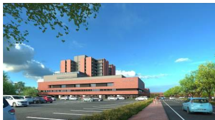
鳥取県立中央病院

鳥取県東部から中部、さらに兵庫県北部を医療圏とし、その中で中核的役割を担っている病院です。現在 431 床で、2018 年には 518 床に増床され、さらに充実した病院となる予定です。病理診断科は特に、癌診療の中核を担い、集学的で緻密な病理診断を目指し、同時に学会活動にも力を入れています。当科の特徴としては通常の病理診断業務に加えて血液診断に力点を置き、さらに表在臓器の超音波診断、細胞採取、外来での結果説明にも取り組んでいます。各診療科との連携・風通しは良好で、初期研修医がしばしば病理診断科を選択研修しています。