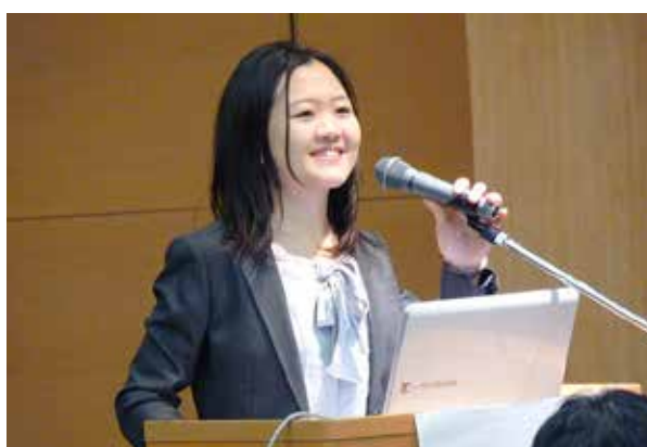
きめ細やかな学会発表指導