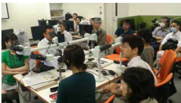
合同症例検討会（くすのき会）