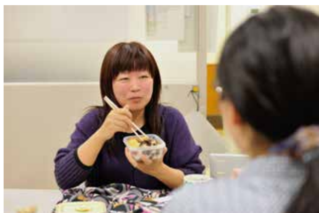
楽しく適切なライフワークバランスで