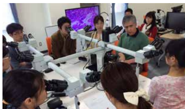
国際的なエキスパートによる特別セミナー