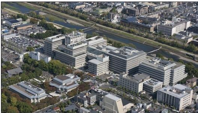
京都府立医科大学および附属病院

一人の専攻医を常に複数の指導医が指導・評価を行うことにより、専攻医の技能習得状況を正確に把握しながら、十分な症例数を偏りのない内容で提供することが可能であり、各専攻医を信頼に足る病理専門医に確実に育てることを目指している。